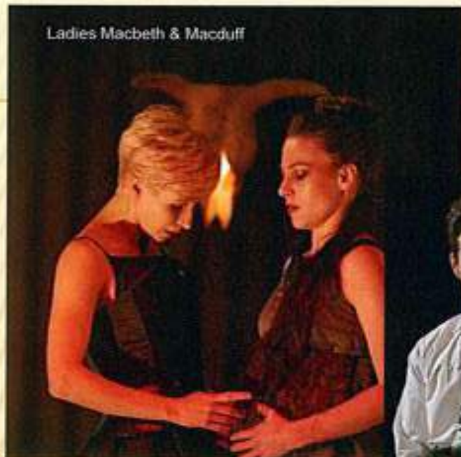
Ladies Macbeth & Macduff