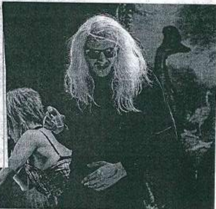
Až lidstvo vymře, nic se nestane. Tak zní motto nové inscenace Divadla Na zábradlí.