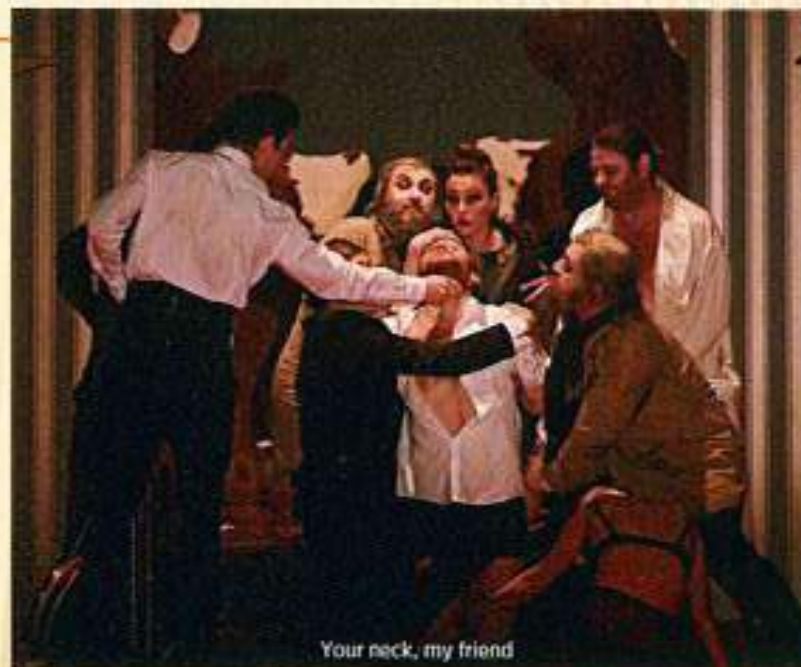
Your neck, my friend

„(...)Toto zpracování Macbetha je úplně jiné než všechna ostatní. Naprosto originální. Je to troufalé, je to drzé, a proto geniální. Z Macbetha se stává montypythonovská komická postavička (Too much pathos!) a Lady Macbeth je vám prostě líto. Není to ta mrcha toužící po moci, ale žena, která netuší, že mlčení zlato (jako ostatně žádná žena) a pak se nestačí divit, co její slova způsobila. A vůbec mi nevadí, že čeští herci mluví při představení anglicky. Právě ta je totiž tou troufalostí, která celé inscenaci dodává originalitu, již v jiném divadle nyní nenajdete.“ Kulturio.cz, 19. 4. 2017 Soňa Hanušová: Macbeth – Too Much Blood. But no sex