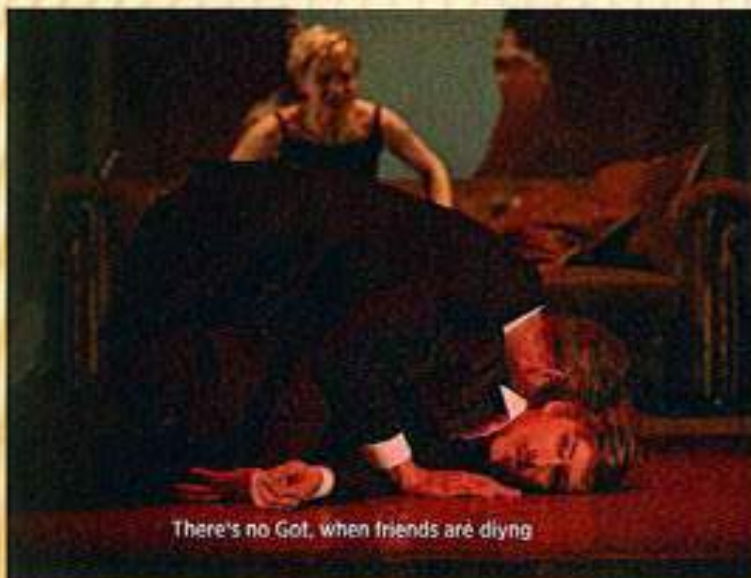
There's no Got, when friends are dying